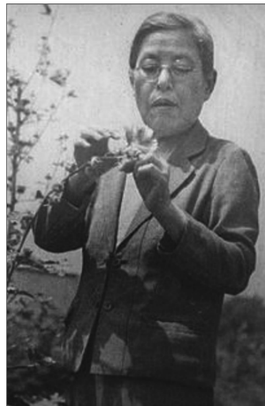
図1 保井コノ博士像