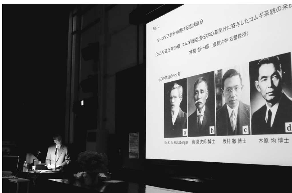
図1 講演する常協先生とスクリーンに映し出されたコムギの4人の先達

レニングラードはソ連時代の呼称で、もともとはサンクトペテルスブルグ(1703-1914年)と呼ばれていました。バルト海に面した都市で、1917年まではロシア帝国の首都でした。ただ、第一次世界大戦(1914-18年)が始まると、ドイツへの反感からペトログラード(1914-24年)と改名され、10月革命(1917年)の主導者であったウラジーミル・レーニン(Vladimir Lenin, 1870-24年)が死去するとレニングラード(1924-91年)と呼ばれるようになります。ソ連崩壊後はロシア帝国時代の呼称に再び戻っています。1913年のフラクスバーガーの依頼は